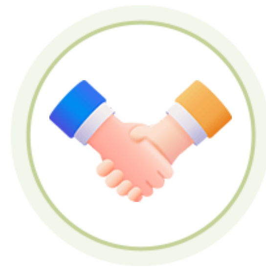
디자인씽킹 워크샵 참여 기회