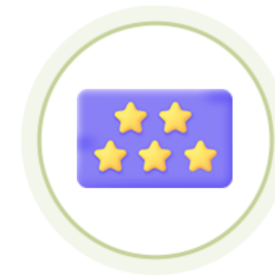
굿네이버스 채용 가산점