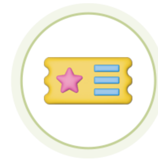
자기개발학습 콘텐츠 이용권