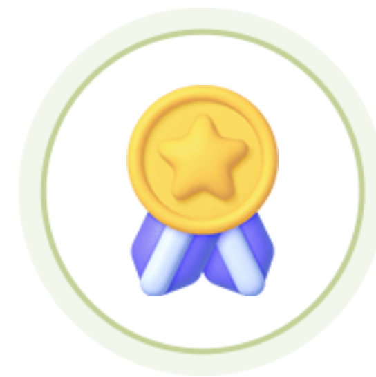
인성 인증 면접 뱃지